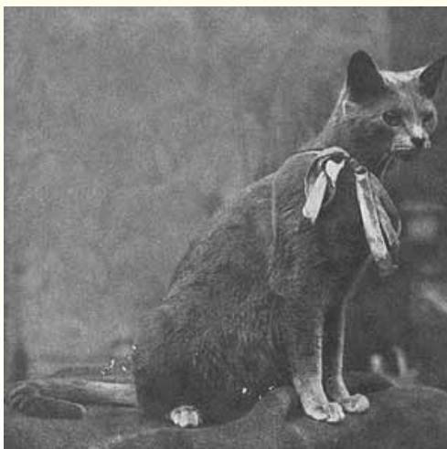
Mignonne de Gueveur, 1931

Tegelijkertijd met de Leger zusjes ontstaat er een Chartreux fokbeweging in het Centraal massief. Deze fokbeweging had zich ook toegelegd op het fokken van een Chartreux zoals die in de boeken stond beschreven maar de door hun gebruikte fokmethode verschilde van die van de Leger zusjes. Deze fokkers werden hoogstwaarschijnlijk door hun Engelse collega's beïnvloed en besloten blauwe British Shorthairs and Perzen in te zetten om sneller een mooie volle kat te verkrijgen met diepe amberkleurige ogen en een krachtig lichaam.