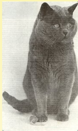
Brynuboo's Little Monarch (British shorthair) 1973

De verschillen tussen de katten van de Leger zusjes enerzijds en die van de overige fokkers anderzijds zijn na de oorlog ook goed zichtbaar. De Leger katten waren iets slanker en eleganter met een iets wollerige vacht en ze bezaten een oogkleur die varieerde van oranje tot zacht geel. De overige Chartreux neigde iets meer naar de Pers en de British shorthair met een intense diepe oogkleur en een wat meer gedrongen bouw. Dit verschil bleef vrij groot omdat het contact tussen beide groepen spaarzaam was.