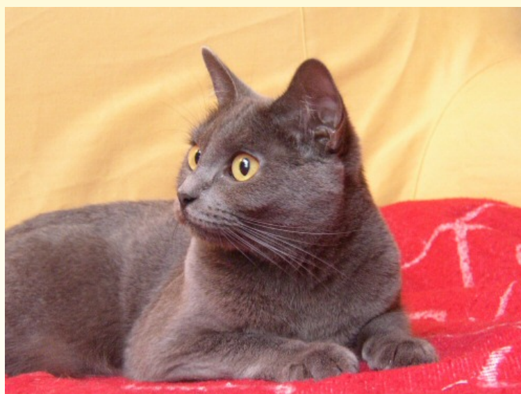
Cb. Vivienne du Gang des Burgondes