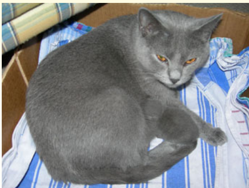
EC. Blue Melody Holy Dolly met kitten Dominiqu Aus Curbechi