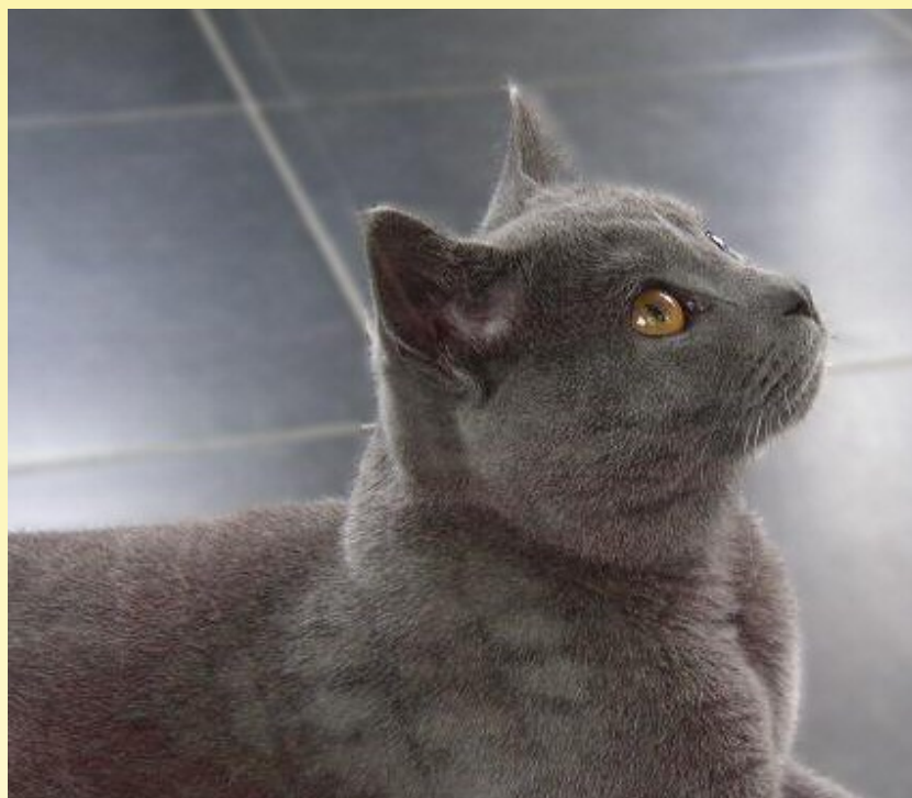
Aramis de Phaselys van cattery 't Spinnewiel